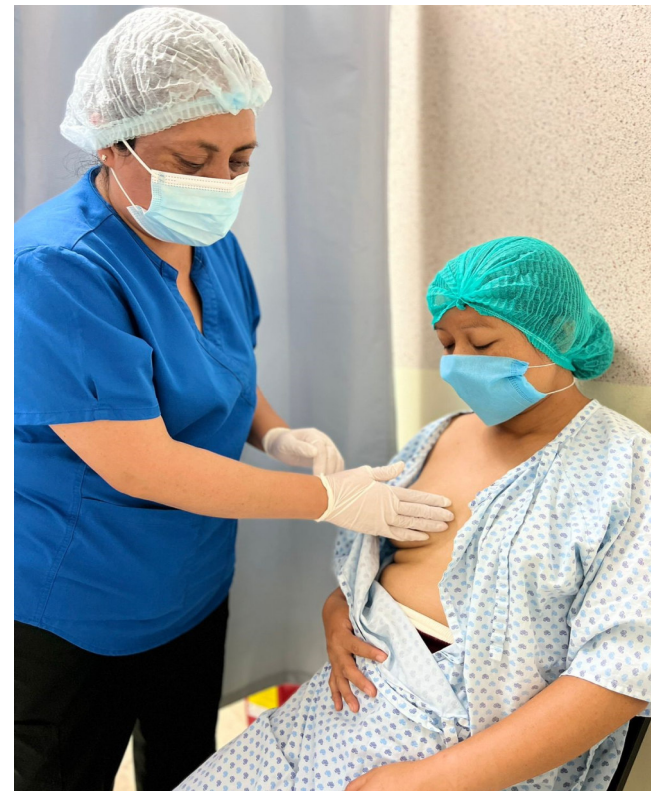
Los lactarios hospitalarios constituyen un eslabón esencial de la Red Estatal de Bancos de Leche Humana.

Actualmente contamos con 17 lactarios hospitalarios , ubicados en hospitales con atención neonatológica UCIN; UCIREN; UCINEX y Crecimiento y Desarrollo. Atención obstétrica y pediátrica (lactantes).