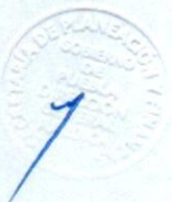
DR. JORGE CARLOS ALCOCER VARELA

Handwritten notes and signatures on the right margin, including a large '9' and several illegible signatures.